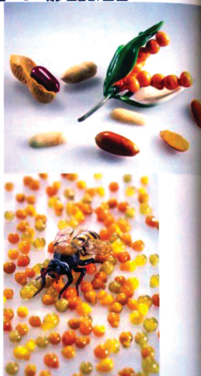
NELLE IMMAGINI, ALCUNE DELLE MINUSCOLE OPERE VITREE CHE L'ARTISTA AMERICANA JUDI HARVEST HA FATTO 'SOFFIARE' A MURANO PER LA SUA INSTALLAZIONE PROPAGATION BEES + SEEDS , FINO AL 26 NOVEMBRE A PALAZZO TIEPOLO PASSI DI VENEZIA, NELL'AMBITO DELLA MOSTRA COLLETTIVA LA BELLA E LA BESTIA (FONDAZIONE VALMONT)

Durante la 57ª Esposizione internazionale d'arte di Venezia, Judi Harvest presenta più di 150 diversi semi, piante e fiori in vetro, dipinti e video nell'ambito della sua installazione Propagazione: api + semi , che offre una riflessione sui semi, sull'impollinazione delle api e sulle piante quali metafore della vita e della rinascita. Propagazione fa parte de La bella e la bestia , mostra promossa (fino al 26 novembre) dalla Fondation Valmont a palazzo Tiepolo Passi (XVI secolo). La Harvest, che ha tratto ispirazione anche dalle banche dei semi come la Svalbard Global Seed Vault di Norvegia, di Propagazione racconta "Ho creato questi semi e piante, in vetro di Murano, per enfatizzare il senso di fragilità della vita e la ricerca della bellezza, che sottende tutte le mie opere". Per realizzare le sue soavi creazioni vitree, la Harvest ha lavorato con sette maestri vetrai di Murano, che utilizzano tre antiche tecniche vitree: cera persa, lume e soffiato. La fornace di Murano con cui l'artista lavora è passata, in pochi anni, da 75 dipendenti a soli quattro. La Harvest ha così iniziato a notare un certo parallelismo tra la scomparsa delle api, colpite dalla Sindrome dello spopolamento degli alveari , e la riduzione del numero degli abitanti dell'isola di Murano e delle famiglie di vetrai. Il suo lavoro ha così cominciato a concentrarsi sulla fragilità di entrambe le 'comunità'. ■ O.C.